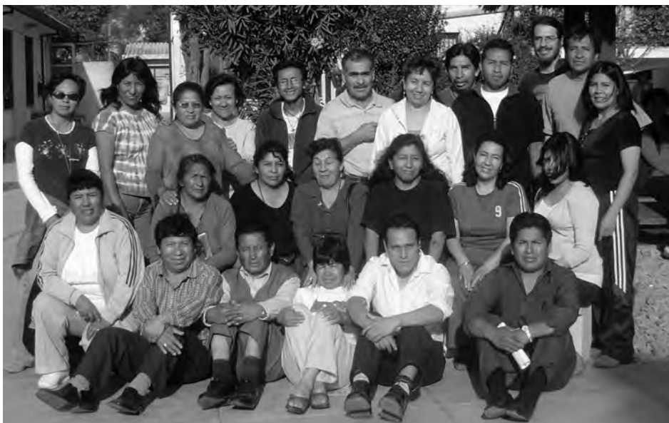
Participantes del primer Curso de Diplomado en Cárceles, 2008