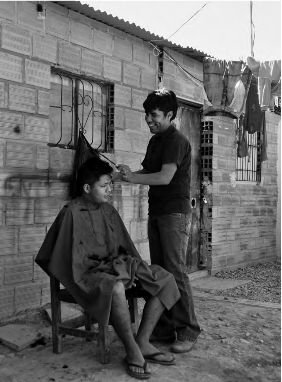
Preso trabajando como peluquero en la prisión Morros Blancos, 2014