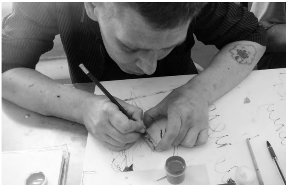
Participante de un curso de habilidades para la vida, que fue parte importante del programa de formación profesional

Las actividades del proyecto se implementaron en dos escuelas vocacionales pilotas y 3 IPs, y se mejoró la calidad de la capacitación vocacional en estas escuelas pilotas mediante la actualización del nivel profesional de los profesores y maestros, la renovación de los planteles y la instalación de equipos modernos para la capacitación práctica de los presos que participaban en el curso.