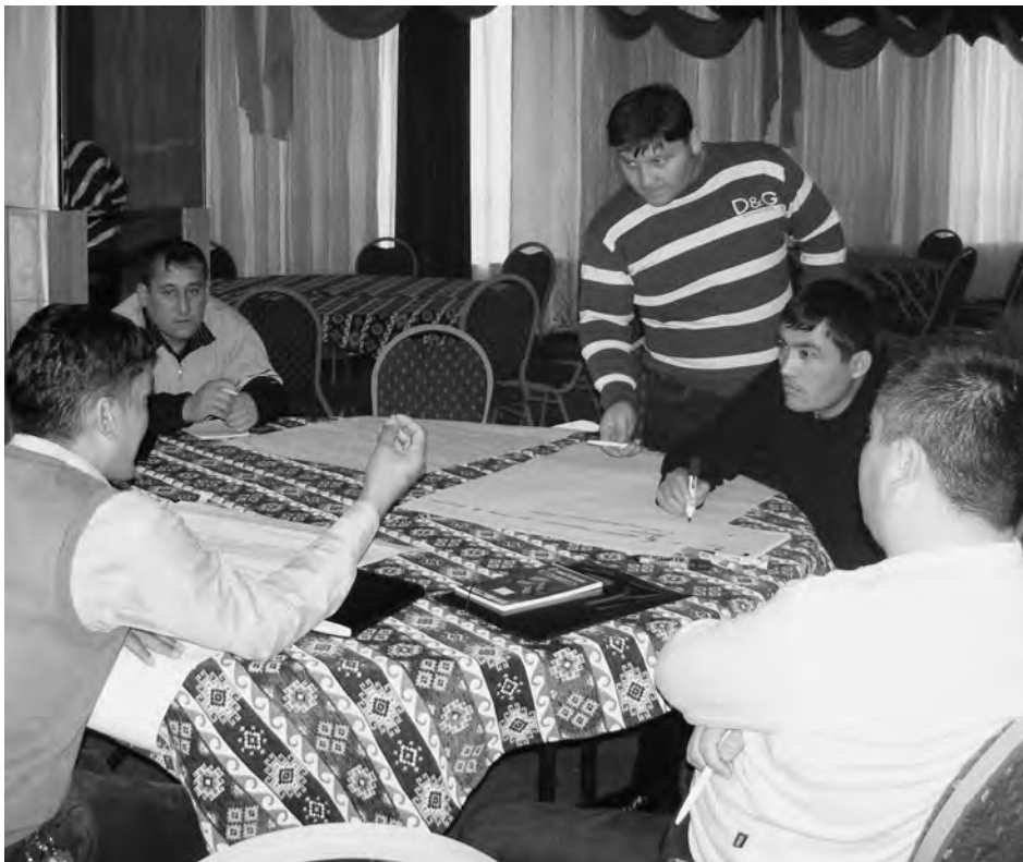
La formación continua para el personal penitenciario en la ética profesional