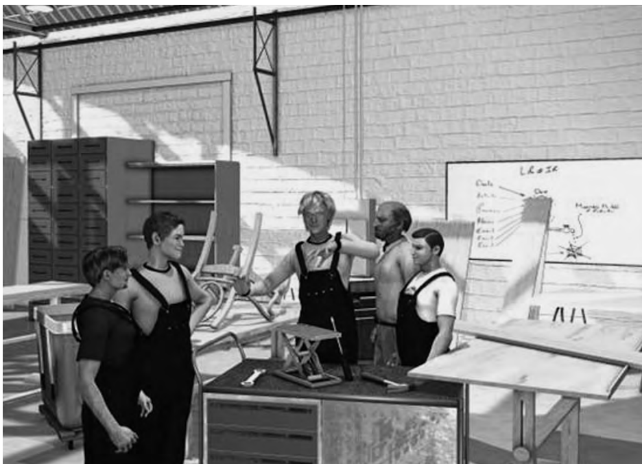
Ejemplo de una imagen del tema "el trabajo"