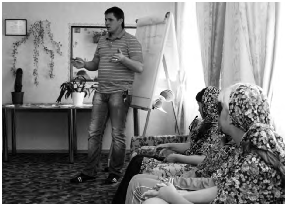
Entrenamiento de habilidades para mujeres presas en la ciudad de Poltava