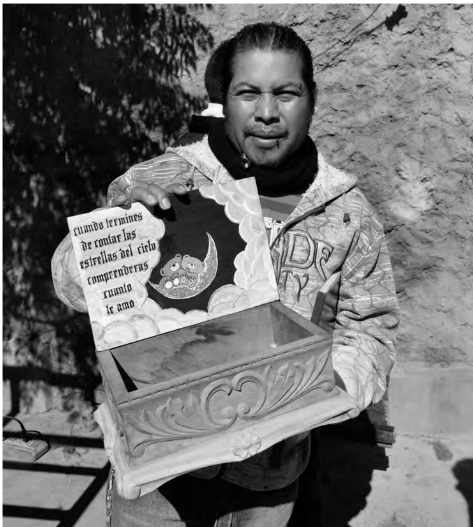
Un preso presentando el trabajo realizado para su hija, en la prisión de Moros Blancos, 2014

tales referidas al sistema educativo y al régimen penitenciario y desde esta precepción, en esta experiencia se ha podido acercar ambas instancias por lo menos en cuanto a sus instancias de dirección (Dirección General de Educación Alternativa y la Dirección General de Régimen