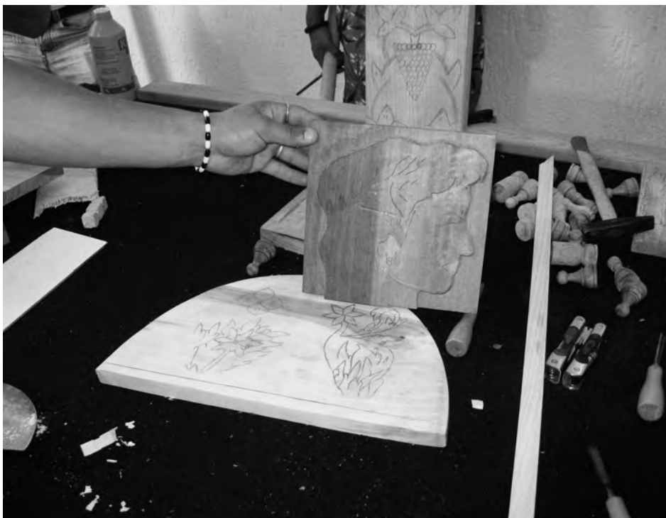
Productos de las clases de la talla de madera en la prisión de Tetovo

de inglés, 100 horas. Los prisioneros ya habían terminado la educación primaria y secundaria y recibieron los cursos en albanés.