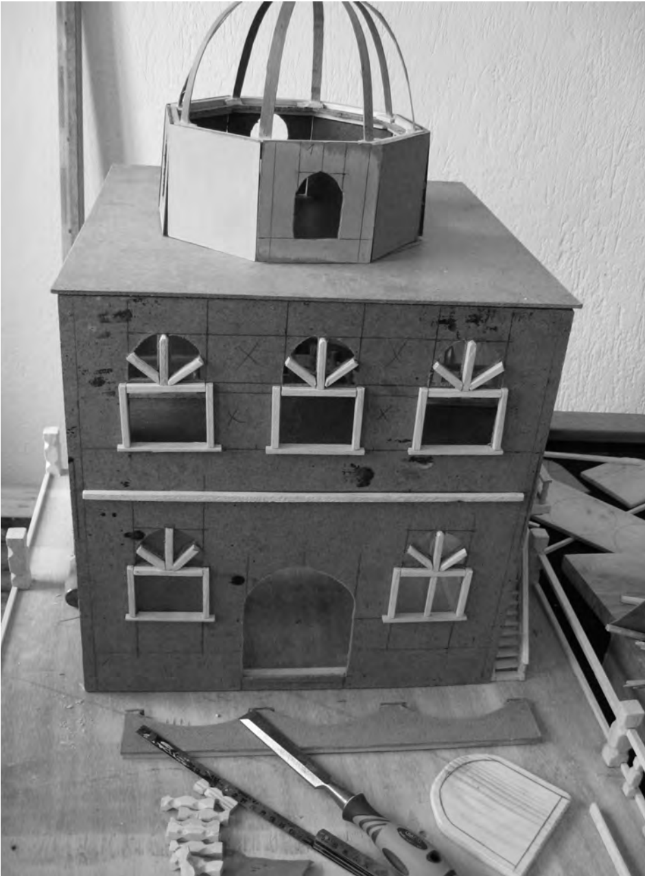
Productos de las clases de la talla de madera en la prisión de Tetovo