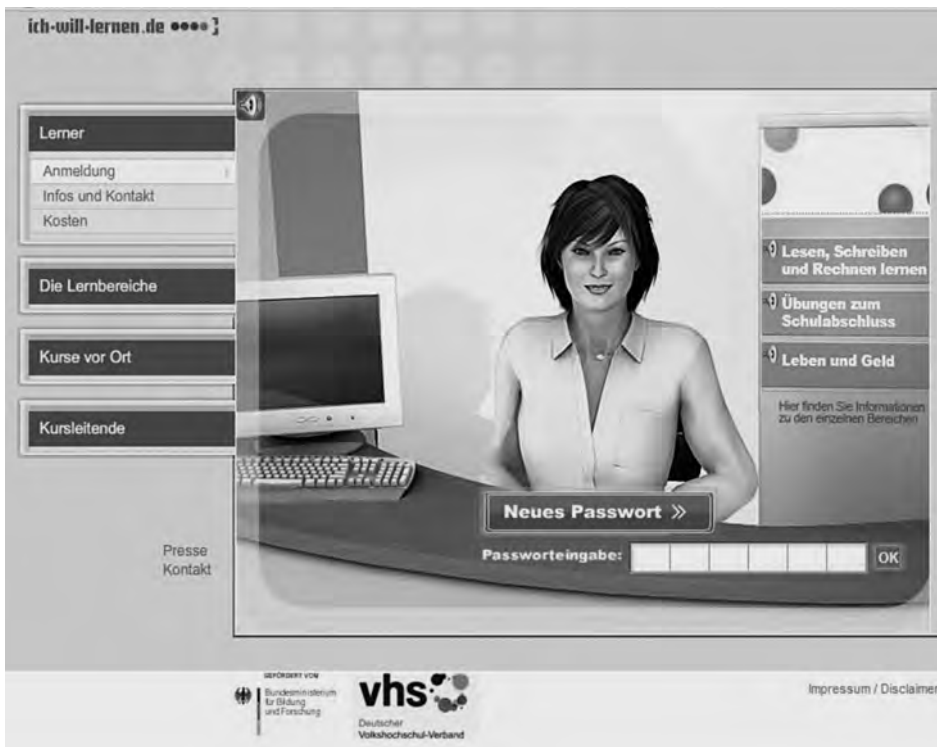
Página principal de www.ich-will-lernen.de

graduarse de la Universidad de Hagen y, por ende, utilizar su ambiente electrónico. Se armaron las conexiones a Internet, fuertemente reguladas, y las actividades en línea de los prisioneros autorizados son estrictamente controladas. Los contactos relacionados con el estudio entre estudiantes son posibles y permitidos. El estado de Baja Sajonia ha llegado más lejos en años recientes. Allí, los prisioneros pueden utilizar sitios web seleccionados y también enviar breves mensajes mediante las PC a través de un sistema especial, un servicio que, sin embargo, implica costos significativos para los usuarios.