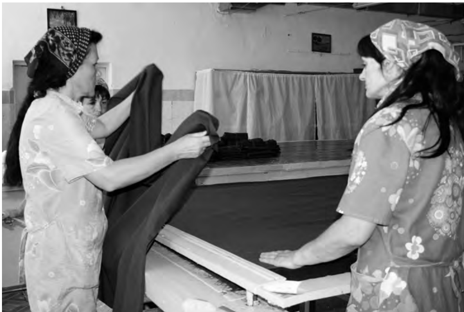
Formación profesional en costura para mujeres presas