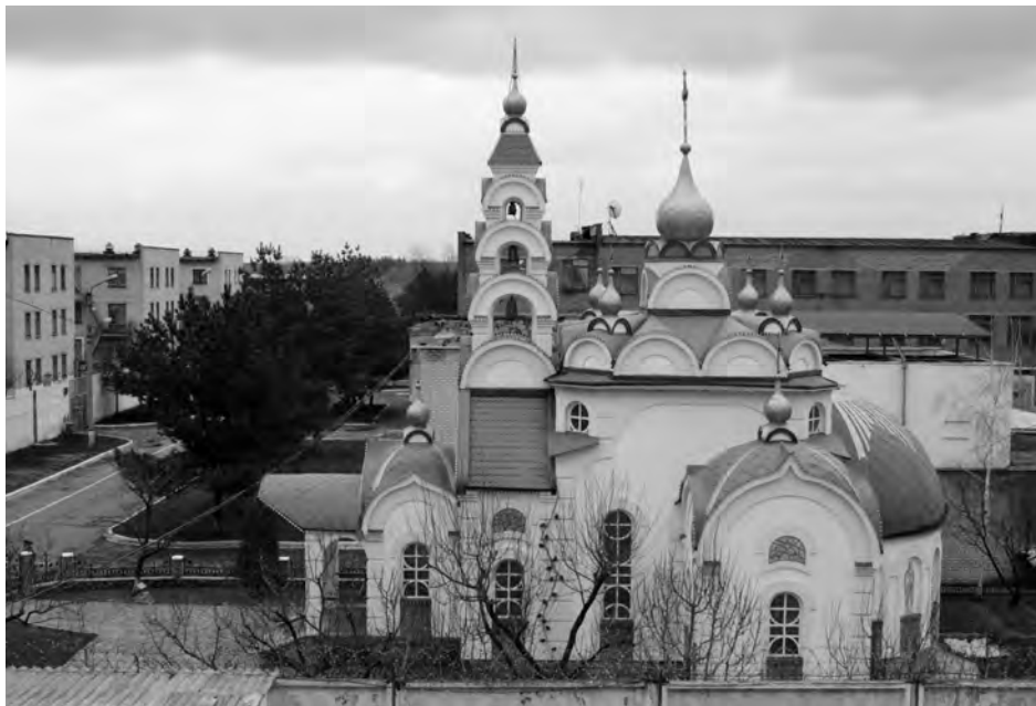
Vista del complejo de la prisión en la ciudad del Poltava

conversar con ellos y conocerlos, se entabló la pregunta de cómo mejorar sus destrezas y aprender algo nuevo. Algunos de los estudiantes del sexto nivel ofrecieron asistir a clases adicionales para mostrar sus diseños y sus visiones de producción, diagramación y selección de materiales. Luego se interesaron en los productos mobiliarios que ahora tienen gran acogida entre los consumidores. Al haber iniciado su trabajo en equipos modernos, los estudiantes poco a poco se dieron cuenta de que ahora pueden adquirir destrezas y la correcta experiencia, algo que no tenían anteriormente. Después de todo, los equipos modernos, a diferencia de sus pares domésticos caducos, les permiten llevar a cabo su trabajo de manera más eficiente y, además, ejercer su visión: añadir nuevos elementos, ofrecer nuevas alternativas de versiones tanto de elementos como de su construcción en términos globales”.