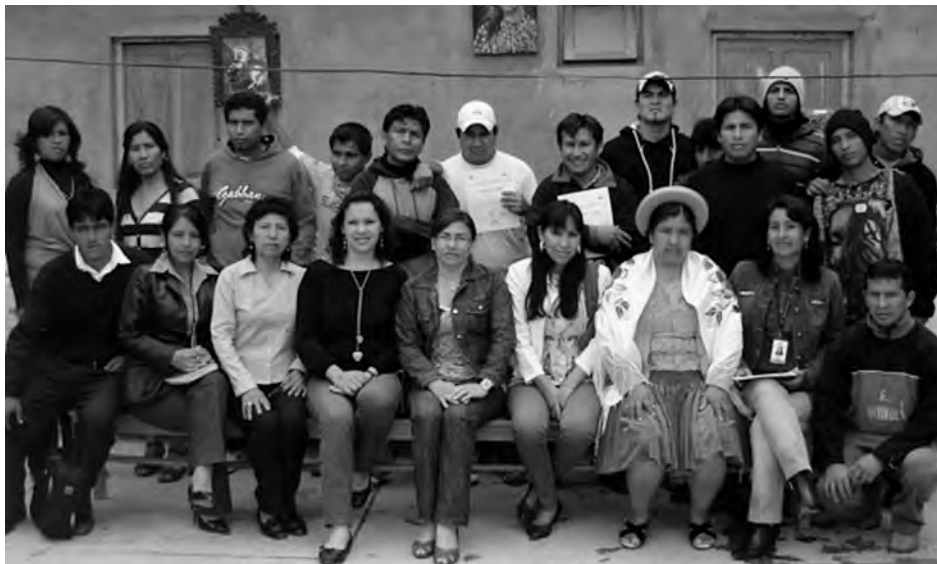
Clausura del taller Pintura en Tela y tallado en madera 2011