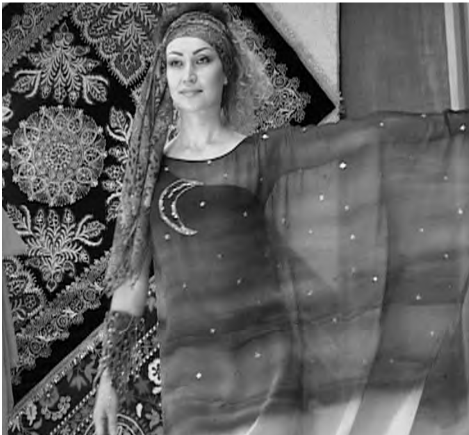
Presentación de los resultados del proyecto en 2011. Todos los textiles fueron hechos por mujeres encarceladas en cursos de formación profesional apoyadas por el proyecto

psicología de la comunicación. En cuanto a los cursos de terapia artística, los reos dibujaban, escuchaban música, veían películas motivadoras y sociales y estudiaban métodos de auto-relajación.