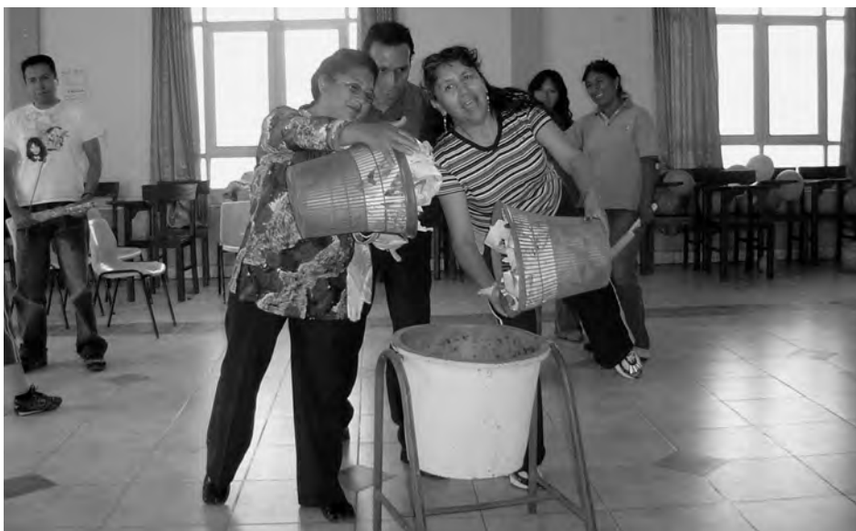
Técnica Participativa – Primer Curso de Diplomado en Cárceles, 2008