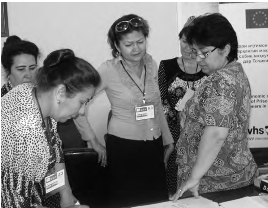
Formación de educadores para la prisión de Dushanbe 2014

se enteraron tanto de las metas y los objetivos del proyecto como de las actividades principales que se realizarán.