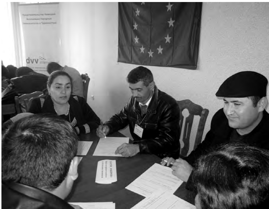
Capacitación del personal penitenciario en las normas internacionales de detención de los reclusos

del personal penitenciario, lo que conlleva al uso de métodos represivos: acoso, violencia, amenazas y otras medidas ilegales.